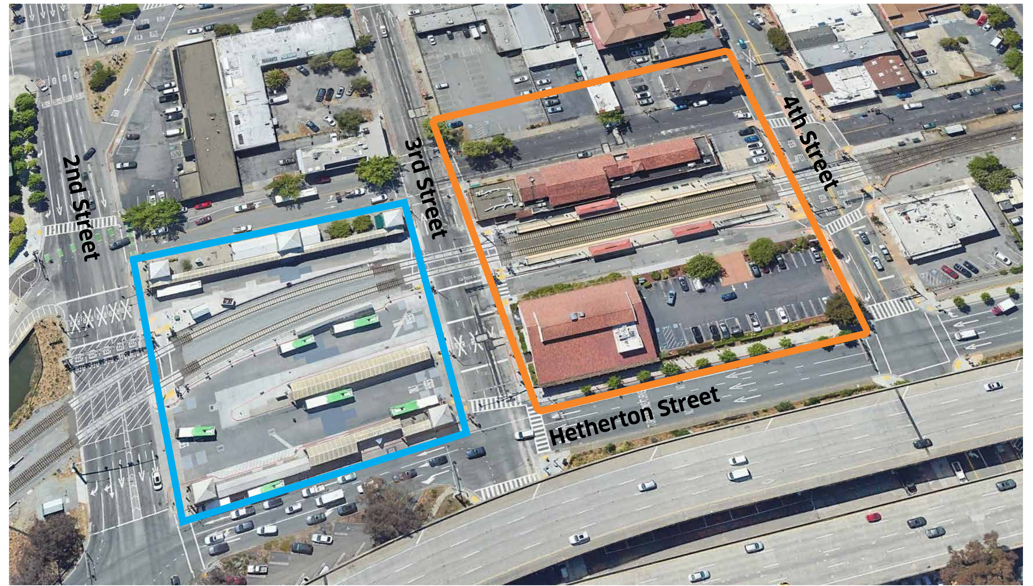
Existing Transit Center Centro de Tránsito Existente New Transit Center Nuevo Centro de Tránsito